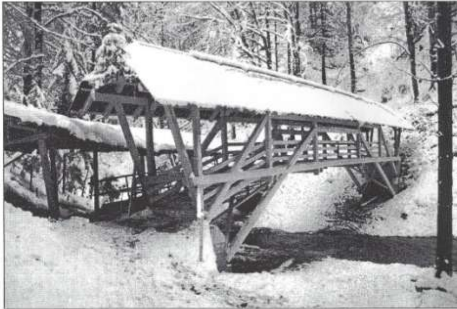
Das fertige und frisch verschneite Mischlerenbrüggli