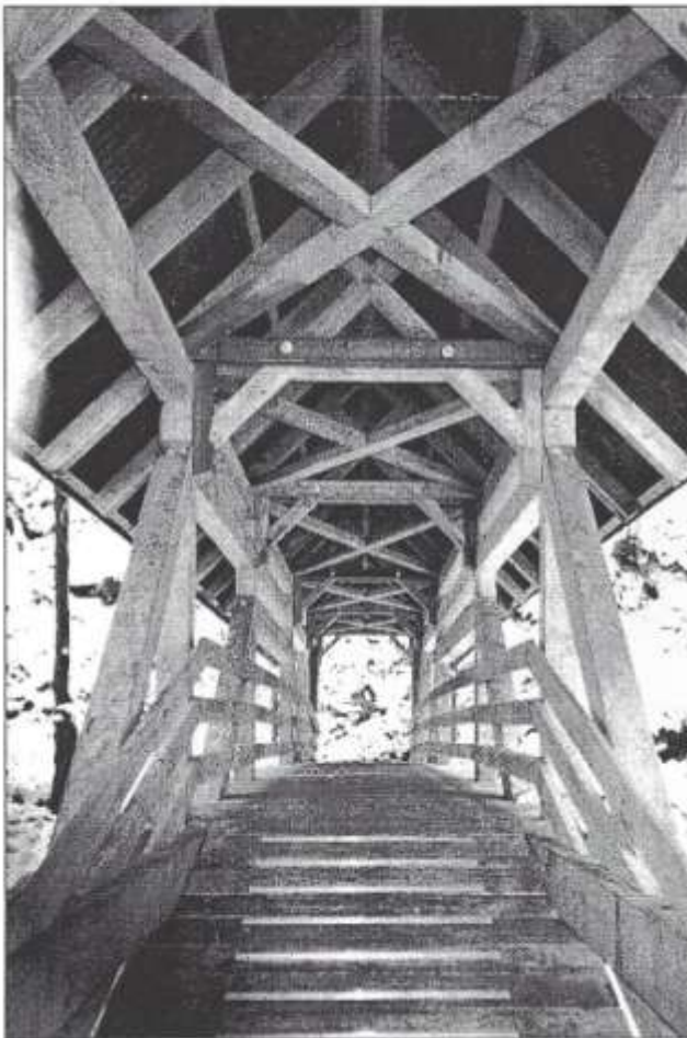
Blick durch die Brücke auf das Holzkunstwerk