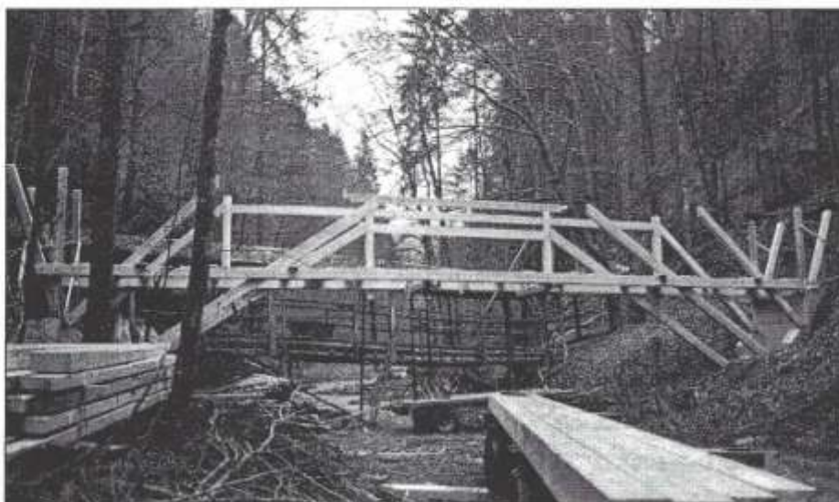
Die ersten Balken beim aufrichten

Am Donnerstag und Freitag wurden Sie von Gemeinderatsdelegationen besucht, die sich vor Ort ein Bild machen wollten.