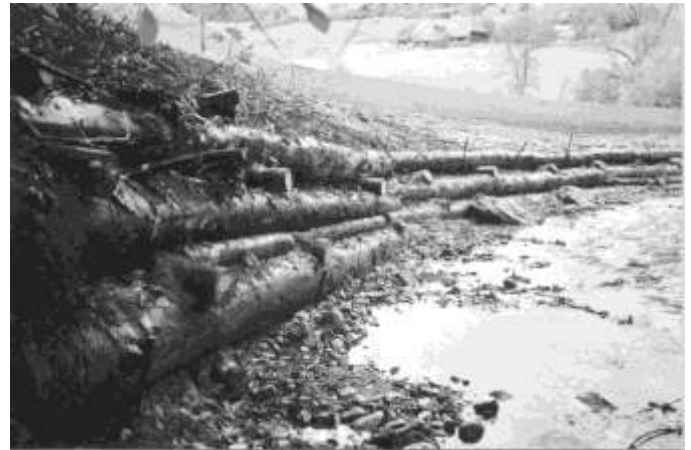
Bachverbauung am Scherlibach

Am darauf folgenden Montag, wurden die Arbeiten vom Tiefbauamt mit Zufriedenheit und ein paar guten Ratschlägen abgenommen. Diese Ratschläge werden wir diesen Herbst vom 21. bis 25. Oktober im WK umsetzen.