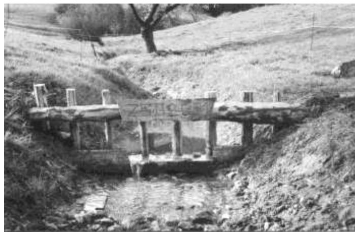
Kleine Geschieberechen -

Anschliessend verschoben sich die Gruppen auf die, von Hinni Werner als Einsatzleiter, ihnen zugeteilten Arbeitsplätze.