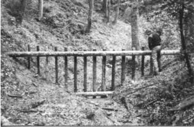
und grosse Geschieberechen

Schwendi. Die Gruppe "Sche" konnte ebenfalls in der Schwendi weitere Geschieberechen in Angriff nehmen.