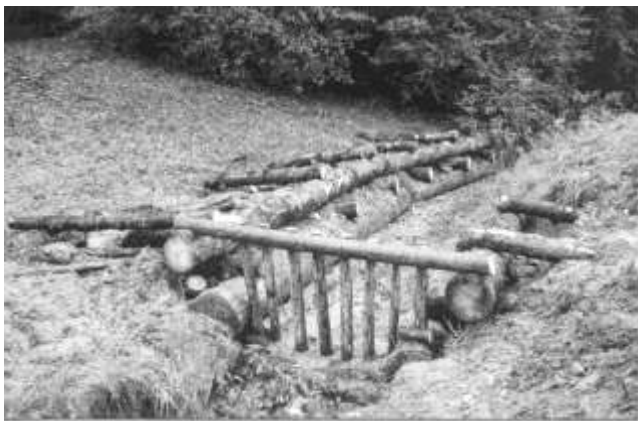
Bachverbauung am Riedligraben mit Geschieberechen

Am Montagmorgen, den 1. Oktober, rückten alle 7 aufgebotenen KVK-Teilnehmer im KP Leitung ZSO ein. "Beheben von Unwetterschäden an Bachläufen", war das Thema des Kurses. Die Liste, auf der die Arbeiten nach Priorität der Ausführung aufgeschrieben war, wurde ziemlich lang. 11 Geschieberechen mussten neuerstellt, ersetzt oder repariert und 4 Bachuferverbauungen erstellt oder ersetzt werden. Dementsprechend lautete auch der Gemeinderatsbeschluss vom 20. September 2002. Dazu kam noch die Anfrage von Förster Minder, ob wir in zwei Wäldern Käferholz aufräumen würden.