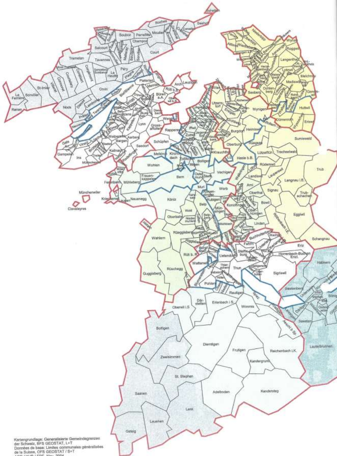
Kartengrundlage: Generalisierte Gemeindegrenzen der Schweiz, BFS GEOSTAT, L+T Données de base: Limites communales généralisées de la Suisse, OFS GEOSTAT / S+T AGR / KUB / FRE, Nov. 2004