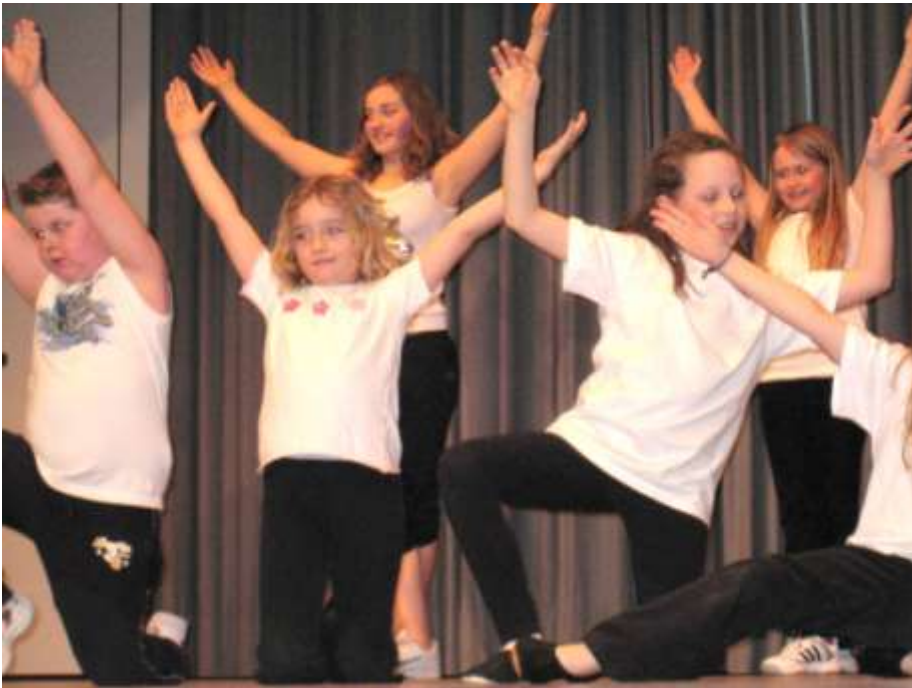
Auftritt der Kids Dance Gruppe am Raclette-Abend vom 1. März 2008 in der MZH.