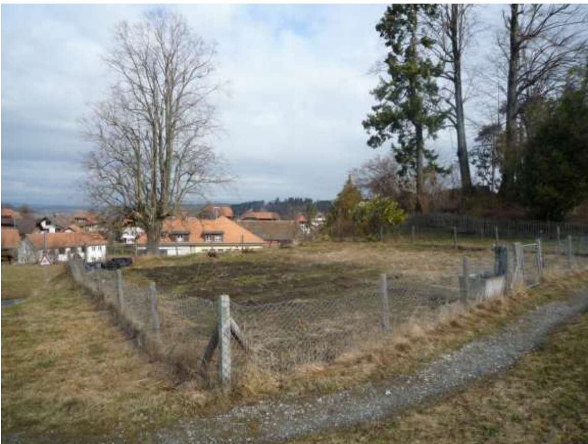
Ehemaliger Schulgarten Oberbalm vor Beginn der Umgestaltung