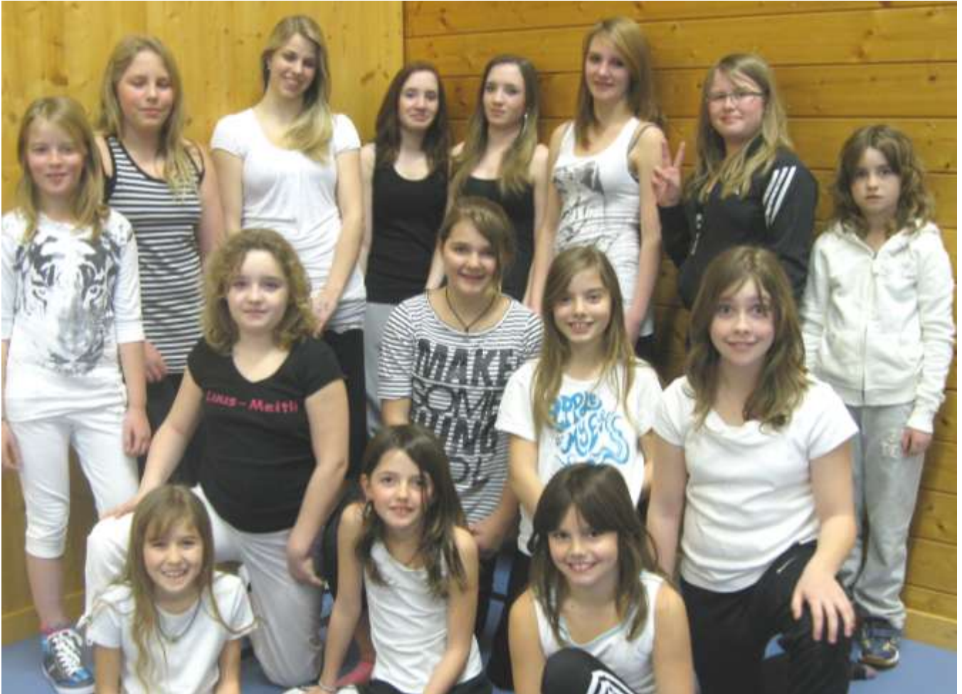
HipHop Dance Teilnehmerinnen 2011